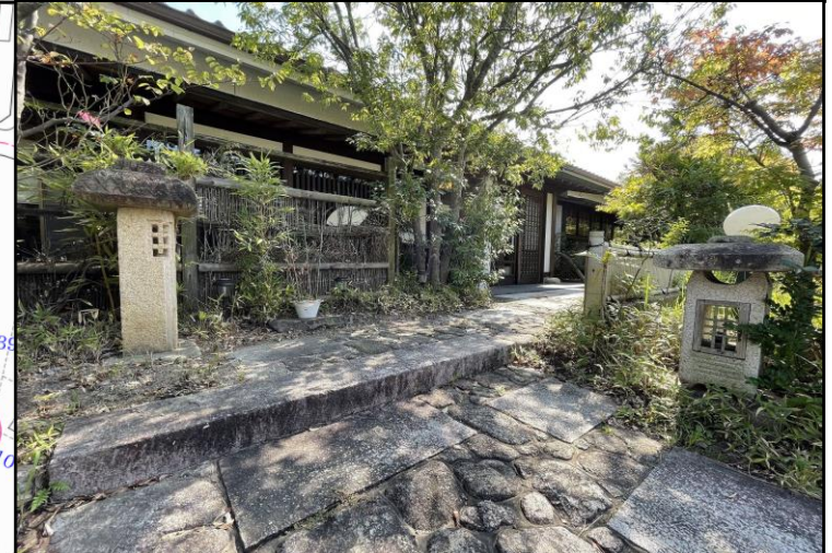
図面と現況に相違がある場合は現況を優先とします。