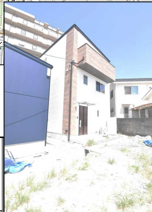
図面と現況に相違がある場合は現況を優先とします。